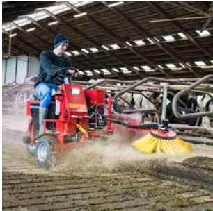
06 PROMAX Kleiner und effizienter Geräteträger