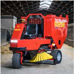
08 SELFLOAD Große Einstreumaschine für leichte Einstreumaterialien