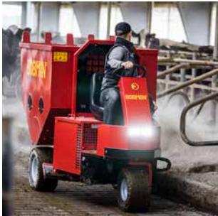
09 POWERLEAD Große Einstreumaschine für grobe Einstreumaterialien