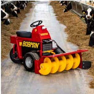
07 MADMAX Großer Geräteträger, perfekt zum Futteranschieben