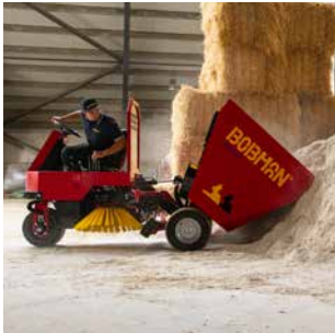
10 COMFORT Große Maschine für schwere Einstreu und zum Mischen