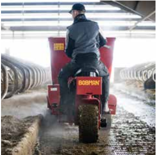
05 MULTILOAD Ideal für schwere Einstreumaterialien und kleine Futtergemische