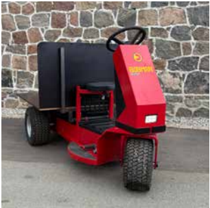
11 COBRA Perfekte elektrische Plattform für den Transport