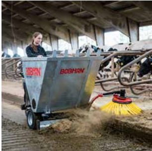
04 FRONTLOAD Schneller selbstladender Einstreuer