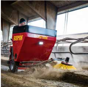
03 SUPER Schneller und effektiver Einstreuer